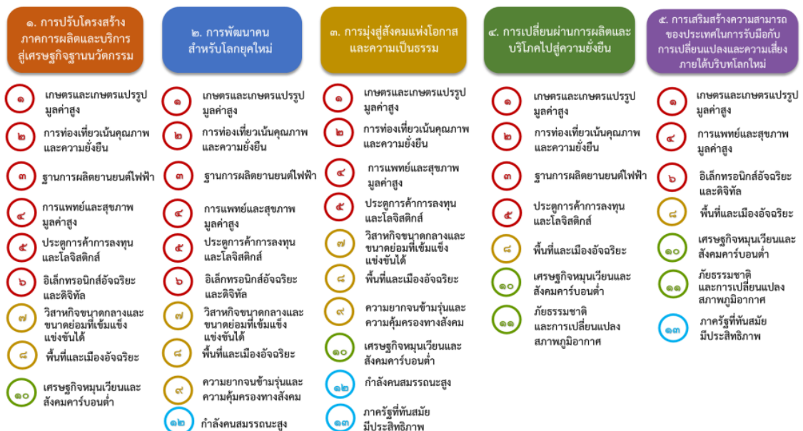
แผนภาพที่ ๓.๑ ความเชื่อมโยงระหว่างหมวดหมู่พัฒนา กับเป้าหมายหลัก

ความเชื่อมโยงระหว่างหมวดหมู่การพัฒนา กับเป้าหมายหลักแสดงไว้ในแผนภาพที่ ๓.๑ โดยหมวดหมู่การพัฒนาที่กำหนดขึ้นเป็นประเด็นที่มีลักษณะเชิงบูรณาการที่ครอบคลุมการพัฒนาตั้งแต่ในระดับต้นน้ำจนถึงปลายน้ำ และสามารถนำไปสู่ผลพัฒนาทั้งในมิติเศรษฐกิจ สังคม ทรัพยากรธรรมชาติและสิ่งแวดล้อมไปพร้อมๆ กัน ทำให้หมวดหมู่แต่ละประการสามารถสนับสนุนเป้าหมายหลักได้มากกว่าหนึ่งข้อ นอกจากนี้การพัฒนาภายใต้แต่ละหมวดหมู่ไม่ได้แยกขาดจากกัน แต่มีการสนับสนุนหรือเอื้อประโยชน์ซึ่งกันและกัน